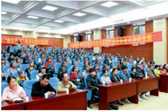
2019年经江县“指尖产业”绣娘培训班开班仪式

不仅专门成立了扶贫工作领导小组和工作办公室，还设立扶贫办，配备专职人员，各成员企业特别是重要骨干企业明确扶贫工作分管领导、牵头部门和具体负责人员，形成了上下联动、全员动员、共同参与的工作格局。2019年中国建材集团党政主要负责人到5个定点扶贫县调研22人次，集团部门负责人、成员企业负责人到定点扶贫县区走访调研、看望挂职干部共236人次。