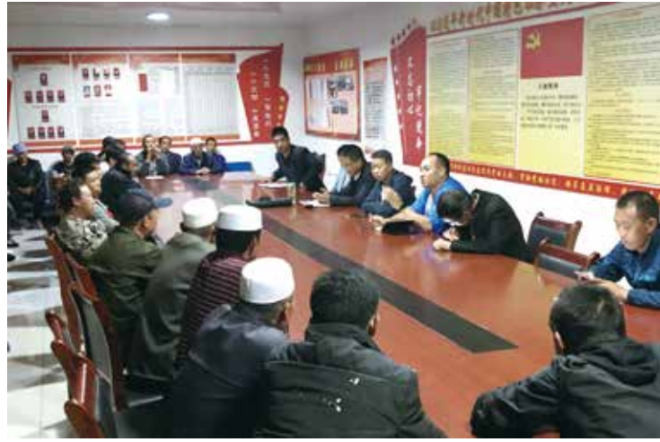
杨岭村党支部研究脱贫工作