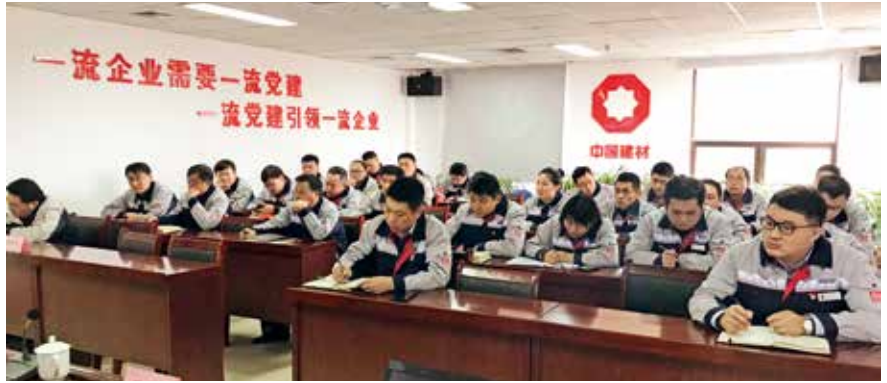
济宁中联党支部书记培训班

在考核方式上，采取“述考”结合，确保考核结果能准确反映出基层党建工作开展成效。每月初由党委书记或副书记带队进行考核，通过集中听取被考核人汇报、“一对一”与被考核人座谈的方式，了解党组织、党员发挥作用情况，党组织是否紧紧围绕中心工作，来思考、谋划和推动党建工作，党员是否发挥先锋模范和示范引领作用；再由公司党群工作部对照考核细则逐项进行打分，最后根据“述考”情况确定最终考核成绩，“述考”结合的考核方式，从根子上解决了形