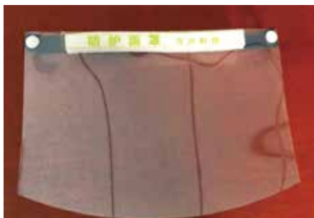
用188ITO膜玻璃生产的防护面罩