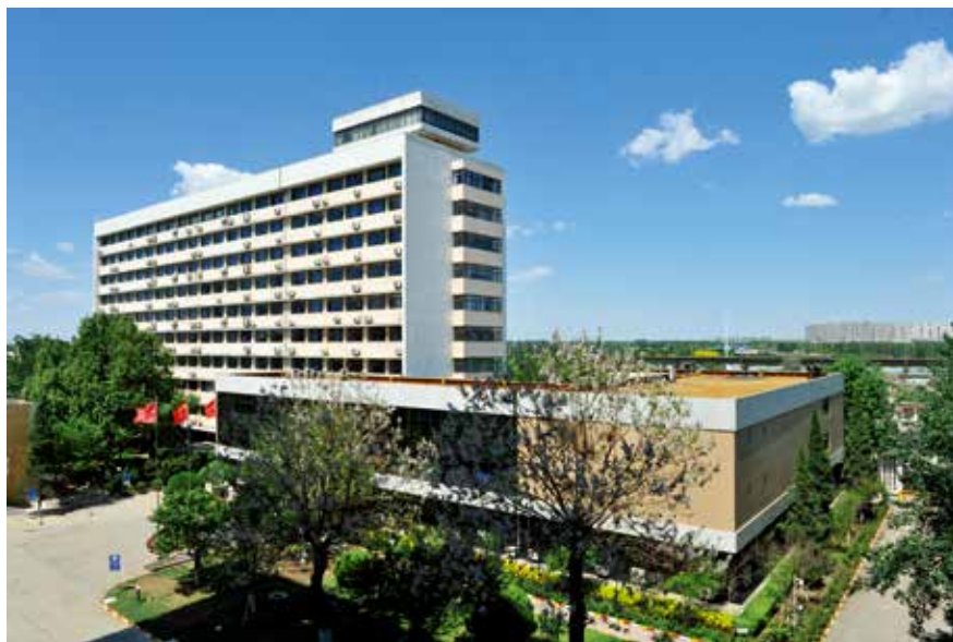
公司办公大楼全景

展，一直潜心做强中国技术和中国制造，从致力实现中国水泥的国产化、低投资，到新时代水泥工业数字化服务在国内外的落地开花，始终坚持以客户为中心，凭借先进精湛的技术、