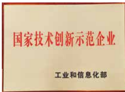
公司获国家工业和信息化部颁发的国家技术创新示范企业

历经67载的春华秋实，天津院以雄厚的科技实力，创立了中国水泥技术发展史上的无数个第一。拥有水泥