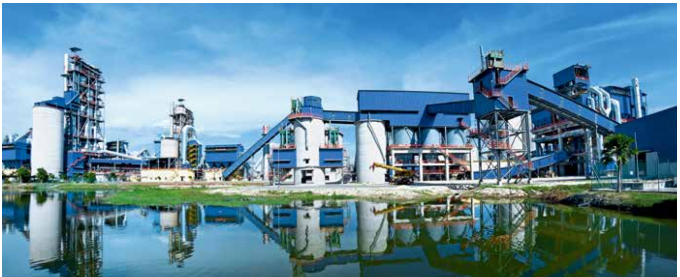
马来西亚HUME日产5000吨生产线：装备国产化率高达97%以上，所有主机设备全部天津院自给，获第十次建材行业优秀工程总包项目一等奖

时至今日，公司已经拥有了冷却机、辊压机、立磨等多项名牌产品，并以其可靠先进的技术性能获得了南方水泥、中联水泥、海螺水泥、金隅冀东、红狮集团等大客户的青睐，在国内技改市场广受好评。冷却机累计国内市场占有率超过50%；研发出的立式辊磨机被认定为“中国单项冠军示范企业产品”。