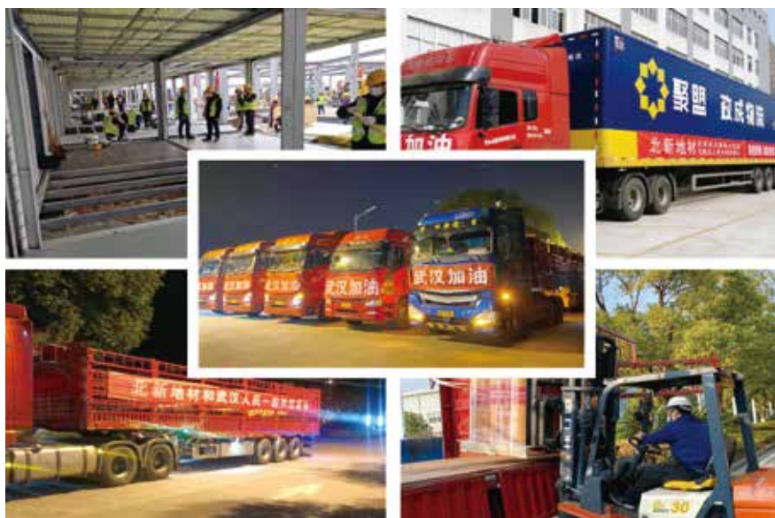
发往“小汤山”式医疗建设地板

地面的标配，产品采用双钢带压延技术，具有高密度和尺寸稳定性，有防火阻燃、抗菌防霉、易清洁等特点，非常适用于雷神山医院，为其提供了安全耐用的工作环境。