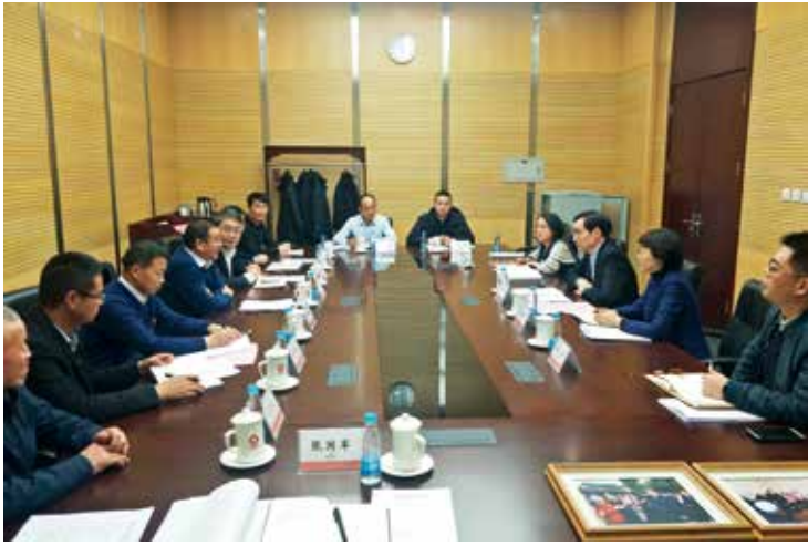
集团领导到泾源县调研