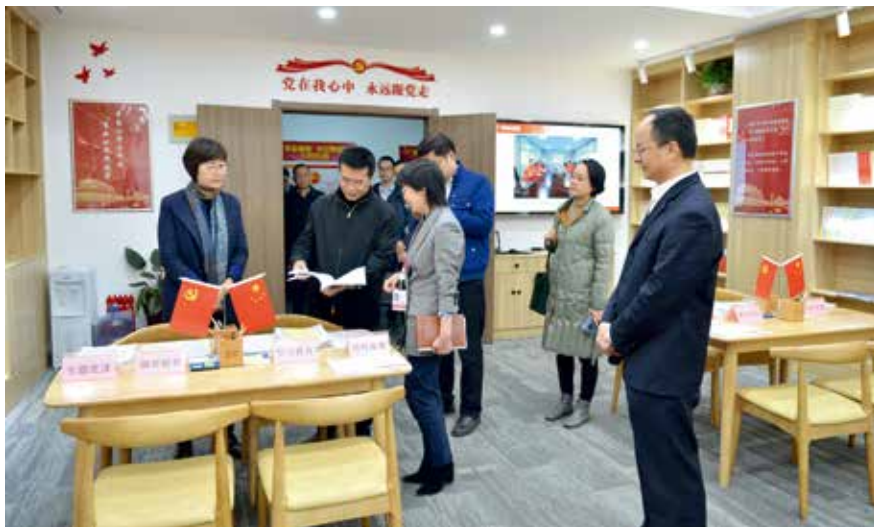
公司扎实开展“不忘初心 牢记使命”主题教育，得到中央第11巡回督导组充分肯定