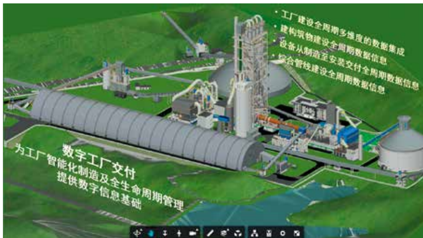
基于自主研发的工业互联网平台，为客户交付数字孪生工厂解决方案

迈入工业4.0时代，数字化、智能化是国内外水泥客户顺应时代趋势发展要求的必然选择，天津院顺势而为，