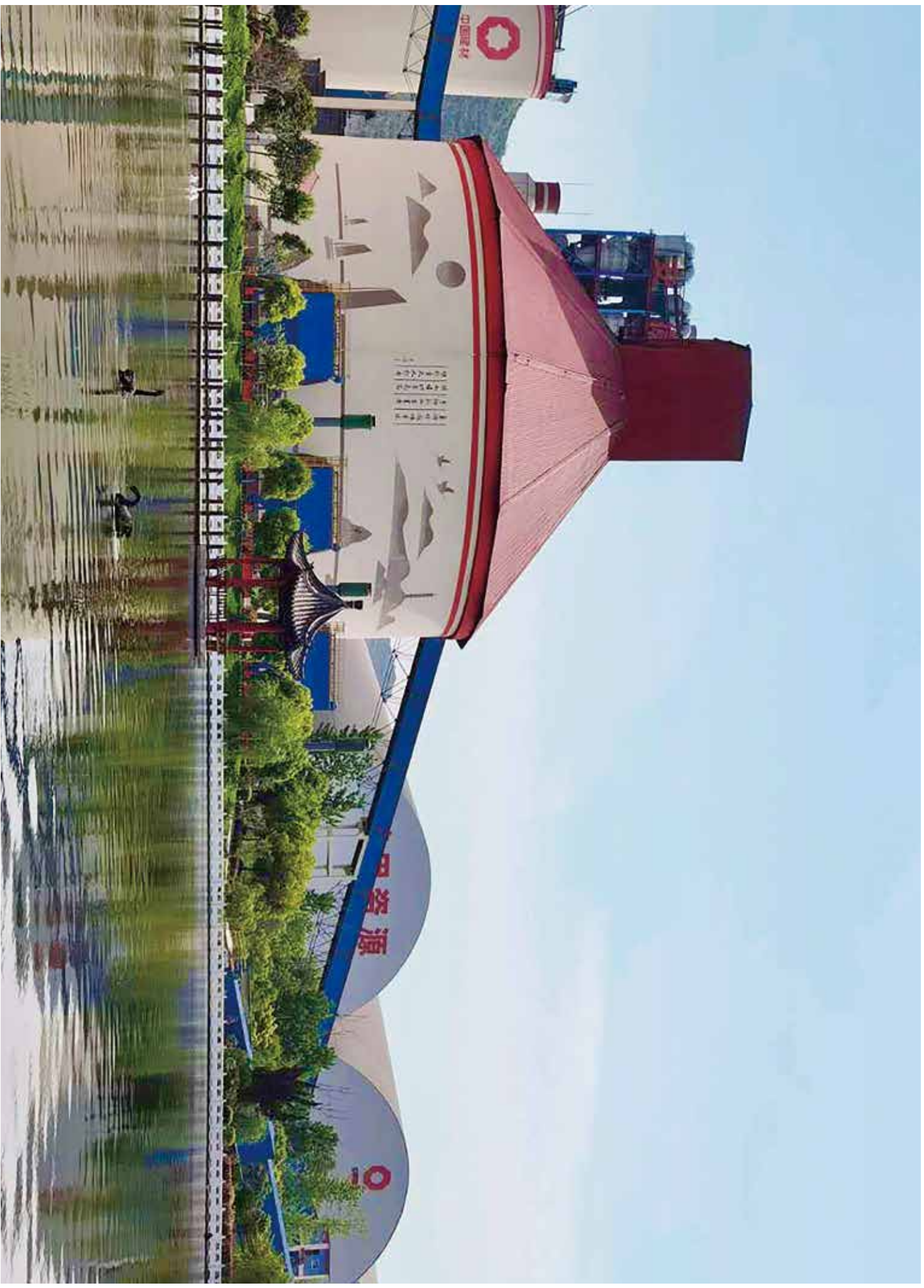
风景如画的水泥厂