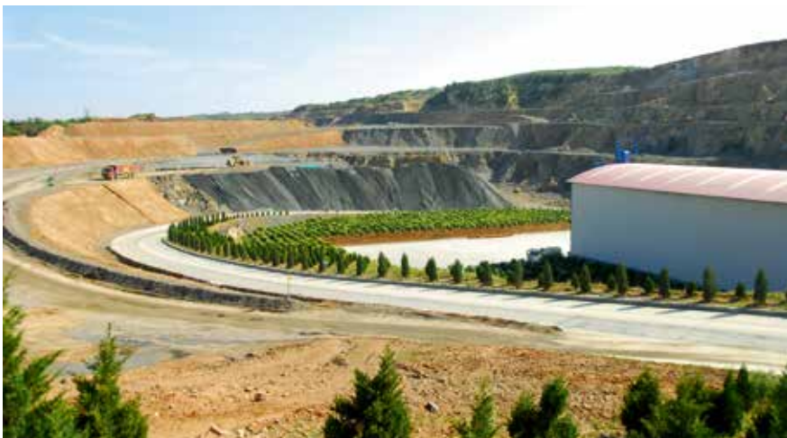
安阳中联参与修复矿山生态环境