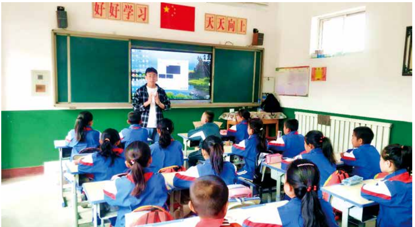
中国建材集团捐资建设48个智慧云教室

“虽然中国建材‘善建’七彩课堂支教工作结束了，但我的心始终牵挂着杨岭村和那里的孩子们。2019年8月，我第一次来到杨岭小学。我们为孩子们精心准备了丰富多彩的课程，短短5天的时间，我们不仅帮助孩子们获