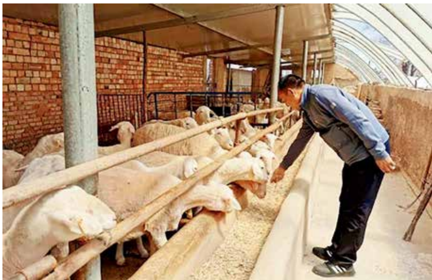
集团精准的资金投向，促进贫困群众持续稳定增收

为了让特色产业有效对接全国市场，中国建材集团还积极搭乘“互联网+”的信息快车，立足本地资源优势，专门打造了纯公益性质电商扶贫平