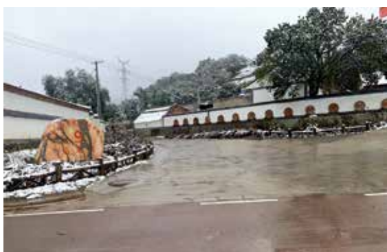
集团援建打造的宁夏泾源县杨岭村“美丽乡村建设”示范项目

习近平总书记指出：“到2020年现行标准下的农村贫困人口全部脱贫，是党中央向全国人民作出的郑重承诺，必须如期实现，没有任何退路和弹性。”