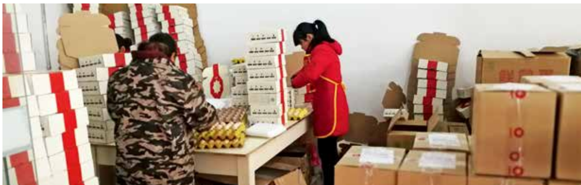
安徽石台县合作社员工正在为禾苞蛋电商平台分装土鸡蛋