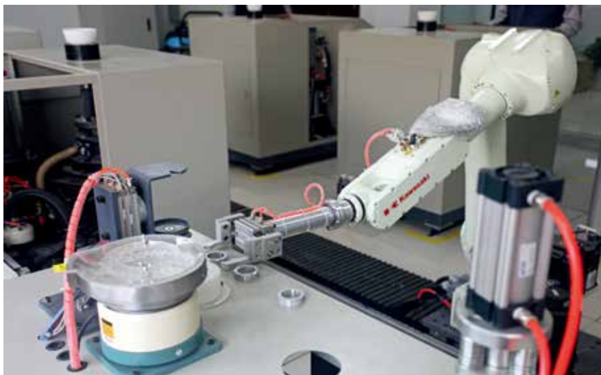
济宁中联智能取样系统

在党建引领和全体党员干部的共同努力下，目前济宁中联所有重点环保治理区域、重点部位、关键装置、重要关口环保治理区域均实现了全过程控制，实现了环保治理全方位、常态化、长效化，环保工作水平大幅提升。其