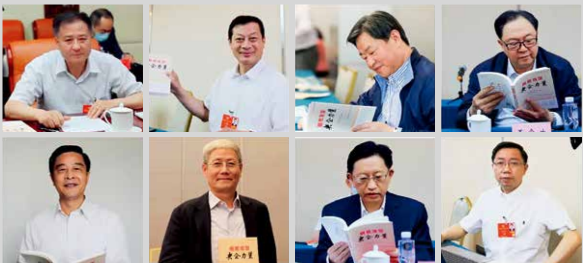
两会代表委员和央企负责人阅读《脱贫攻坚 央企力量》一书

中国建材集团有限公司(以下简称中国建材集团)作为国资委直接管理的中央企业,在致力于成为具有全球竞争力的世界一流材料产业投资集团的同时,也在践行着央企应有的社会责任——扶贫攻坚。