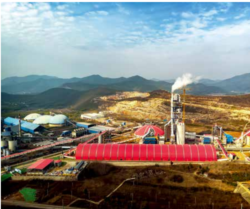
槐坎南方日产7500吨绿色化、数字化、智能化生产线：第二代新型干法生产技术应用示范线

最新技术服务集团。 水泥是集团发展的重要支撑，天津院以最新二代技术助力集团水泥企业发展，积极推进智能工厂、绿色工厂、美丽工厂建设，努力为集团水泥产业节能、降耗、提产、智能化发展作出贡献。