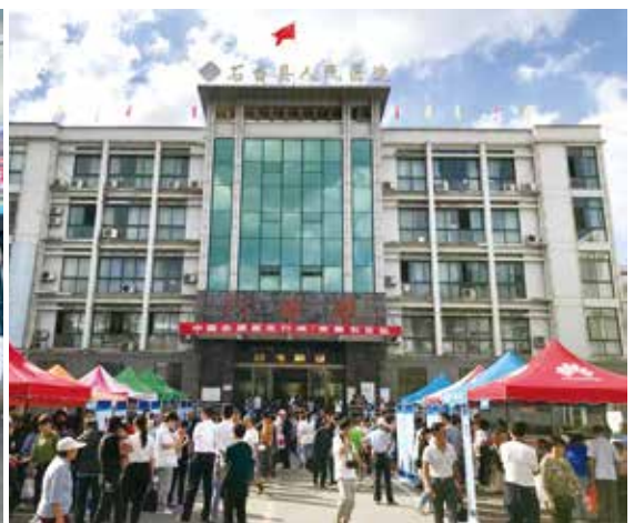
2019年9月21日，集团在安徽石台县举办志愿医生医疗扶贫活动