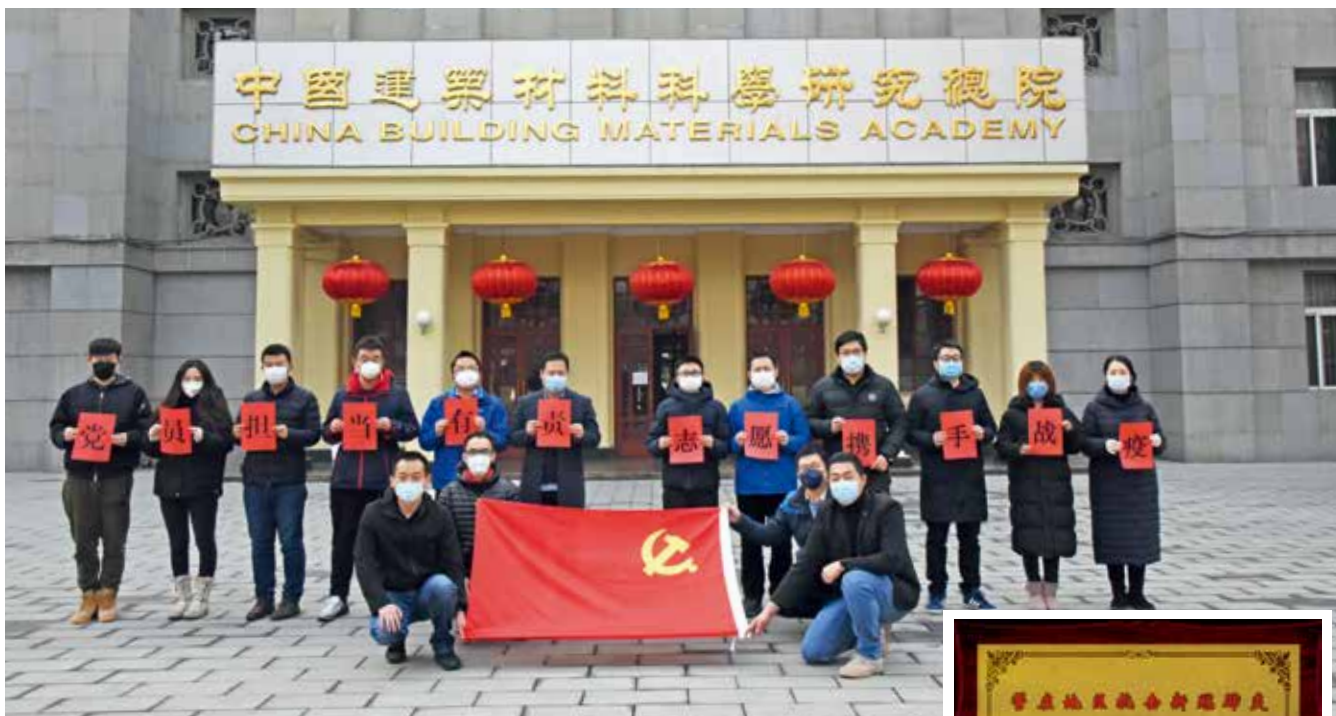
党员志愿者队伍，加强联防联控