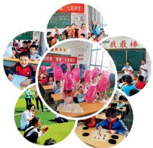
2019年暑假在定点帮扶5个县区开展善建公益七彩课堂活动

如何在解决贫困群众看得起病、看得好病、看得上病和少生病的问题的同时，又通过“输血”和“造血”相结合，来提高贫困地区的医疗卫生服务能