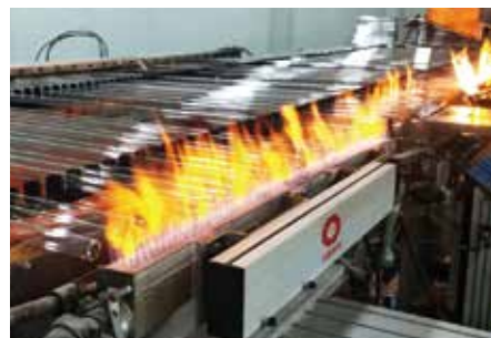
凯盛君恒5.0中性硼硅药用玻璃生产线