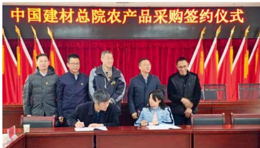
农产品采购签约仪式