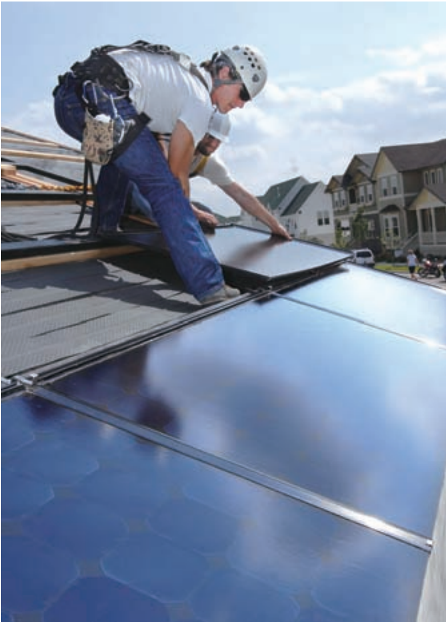
工人安装太阳能电磁板

注册专利的1%，所有欧洲国家拥有的注册专利仅占总数的3%。日本索尼、富士和夏普是这些太阳能电池注册专利的主要拥有者。日本推行的示范工程包括：BIPV工程示范，光伏住宅集中并网示范（200座3kWp光伏住宅集中在一个地区进行并网运行），光伏住宅推广计划（1994—2002已经安装了80000套），地方新能源促进计划和企业新能源资助计划等。日本于1998年制订了新的能源战略，要点是努力实现合理有效的稳定供应，将