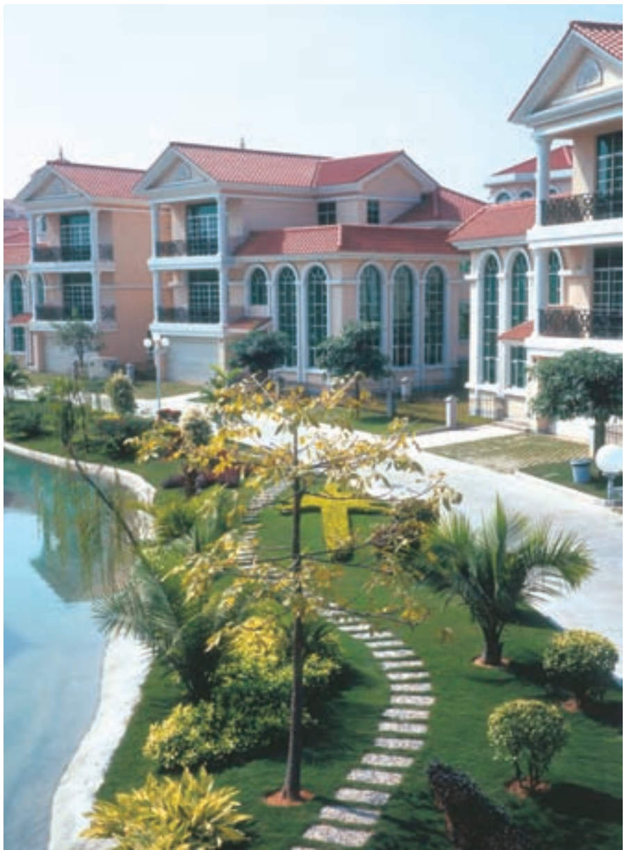
我国建筑节能等级的提高，高效节能的外墙外保温体系在未来会得到更大发展

随着我国建筑节能等级的提高，高效节能的外墙外保温体系在未来会得到更大发展，从模塑板外墙外保温系统、挤塑板外墙外保温系统到聚氨酯硬泡外墙外保温系统是未来发展的方向，但解决其有机物料易燃的问题