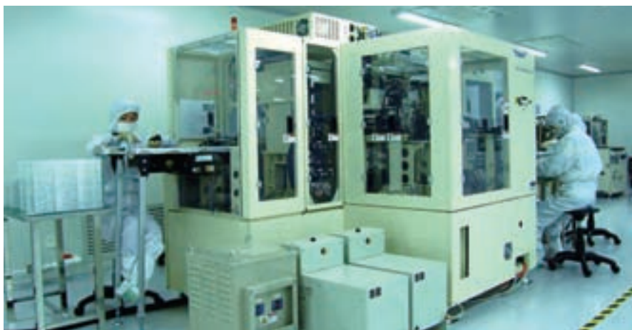
华光集团方圆光电液晶显示模块生产线

总之，集团“五五”前期普法工作已取得了显著的成效，达到了集团干部职工法律知识更加丰富，法制观念明显增强，领导干部依法治企水平不断提高，内控制度更加健全，公司依法经营能力不断增强的目的。尽管我们取得了一定的成绩，但与全省兄弟企业相比还存在差距，同时企业依法经营、依法管理也是一个长期、艰巨的过程，我们将以党的十七大精神为指导，按照依法治企的总体要求，紧紧围绕华光集团“二次创业”的总体目标，推进集团依法治理进程，提升企业经济效益，为我省建材工业的振兴发展做出贡献。