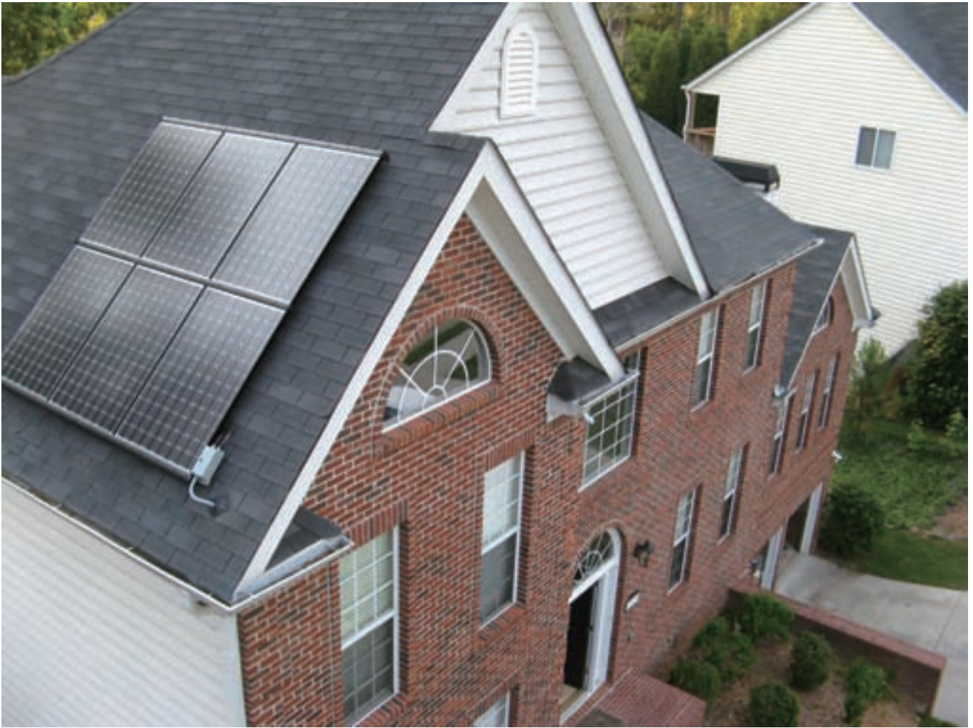
屋顶上的电磁板工程

从2009年开始，上网电价将每年减少2%直至2020年。到2016年计划总安装量达到3000MW。并且采用固定上网电价，20年不变。