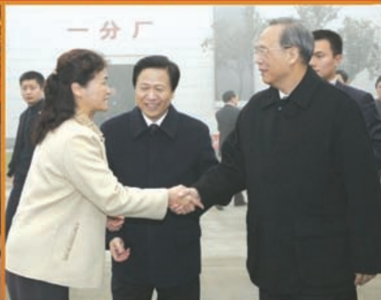
2007年12月30日，国务院副总理曾培炎视察中国建材集团所属中复连众复合材料集团有限公司和中复神鹰碳纤维有限公司时，与姚燕总经理握手。