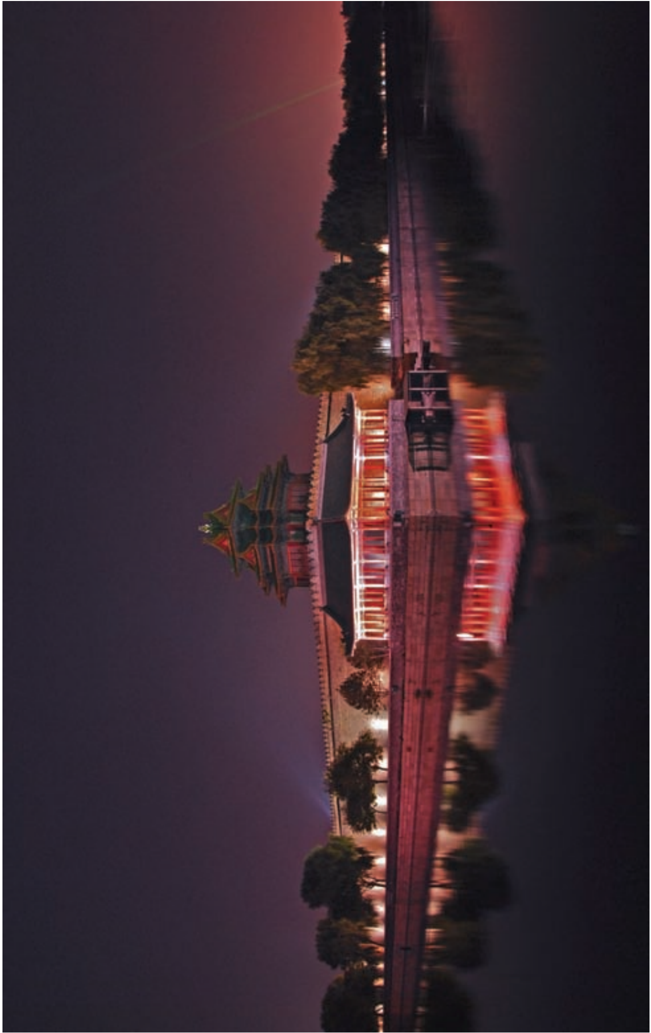
角楼夜景