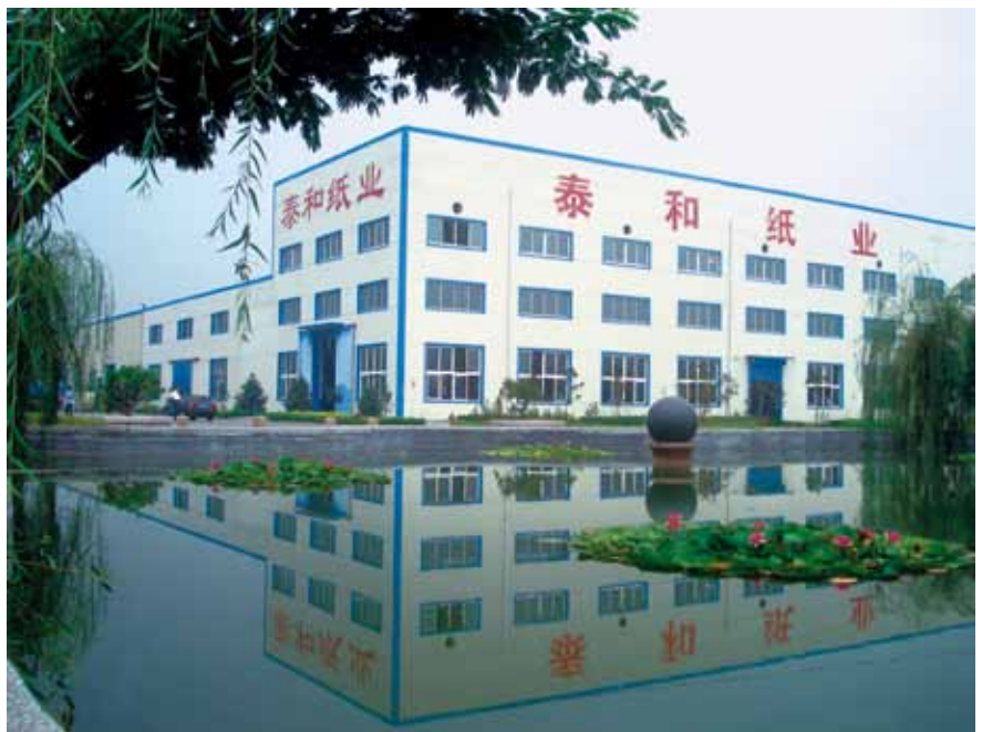
资源综合利用配套产业——泰和纸业

泰山石膏一直将“和谐创新、报效社会”作为企业精神，并始终坚信“不创造生态文明，就无法续写物质文明”。如今，发展循环经济在泰山石膏已经成为一种文化，在这些理念的引领下，把资源的综合利用细化到每一个小的生产环节，实现了厂内生产过程的良性循环。除工业副产石膏的全面利用外，每年30万吨高品质护面纸生产也全部以废纸为原料，实现了再生化生产，节约了大量木材，对我国