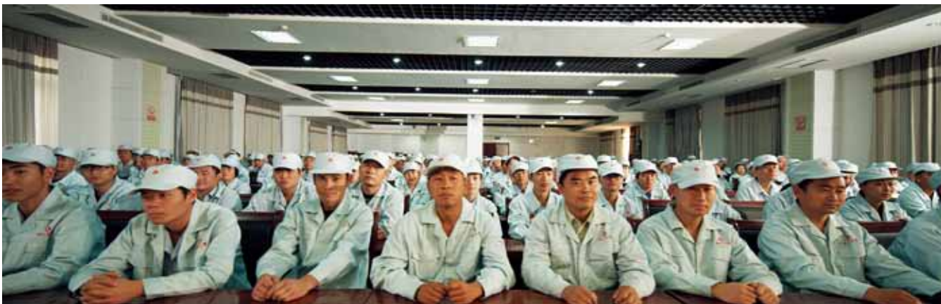
完善的职工技能培训

森林资源的保护意义重大。在制浆生产过程中，不添加化学药剂，有利于废水的处理和循环利用。另外，泰山石膏还通过沼气发电、余热回收利用、废品改性再造等方法，全面实现了对废物、废水、废气、废热的全方位再利用，实现资源综合利用的常态化，开创世界石膏板行业的多项先例。目前，泰山石膏已经踏上了资源综合利用、发展循环经济的“快车道”，走出了经济社会发展与生态环境保护共赢的新路，为子孙后代留下可持续发展的“绿色银行”。泰山石膏被国家环保总局评为“双绿色之星”企业，成为国家资源综合利用、发展循环经济的标杆企业。