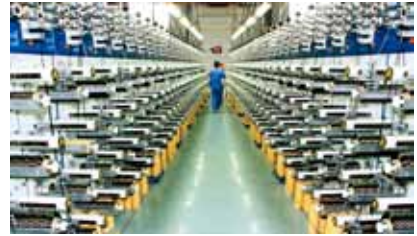
碳纤维生产卷绕机

1. 高性能玻纤低成本大规模生产技术: 开发高性能玻纤配方、纵向双H通路结构、智能化成套装备等技术及装备, 总体技术水平达国际先进。建成全球最大的单窑年产能12万吨的智能化池窑拉丝生产线和埃及年产8万吨高性能玻纤示范线, 实现我国玻纤行业首次海外技术输出。 2. 干喷湿纺高性能碳纤维工程化技术: 攻克高性能碳纤维规模化、稳定化生产系列关键技术及装备, 实现千吨级T700、T800级高性能碳纤维的连续稳产, 成为国内唯一、世界第三个掌握干喷湿纺工艺技术企业。产品性能达到国外同类产品水平, 国内市场占有率超过50%。