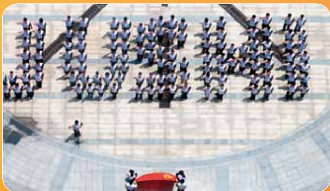
中国巨石党委开展“两学一做三重温”党员活动，重温入党宣誓、重温入党誓词、重温党的历史。