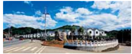
北京密云石城镇新村

掌握轻钢结构房屋、三板一柱房屋、PC房屋等完整的新型房屋技术体系, 突破房屋工厂化生产、现场模块化快速拼装等关键技术, 实现材料房屋一体化、设计生产施工一体化、建筑施工装配化, 建成多个绿色小镇、乡镇住宅等, 进入发达国家市场。