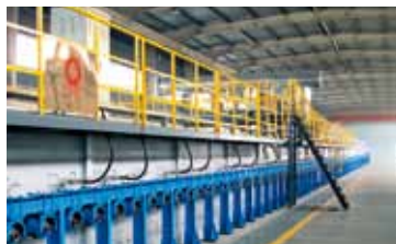
国内首条全氧燃烧玻璃生产线

1200t/d 优质浮法玻璃生产线，实现成套装备国产化，达国际领先水平，荣获国家科技进步二等奖。