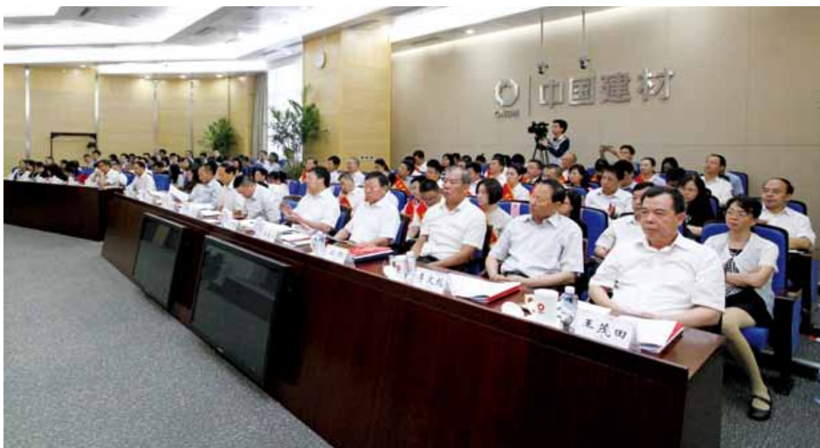
中国建材集团庆祝中国共产党成立95周年暨七一表彰大会现场

坚持“企业是人、企业靠人、企业为人、企业爱人”理念，以党建带群建，深化党群共建。组织动员广大职工在企业改革发展发挥主力军作用。组织开展职工技术革新奖活动，激发了一线员工创造活力。深入推进学习型组织建设，开展“读书会”活动，形成了“把时间用在学习上、把心思放在工作上”的良好氛围。举办乒乓球比赛、篮球赛、羽毛球联谊赛等形式多样的职工文体活动，进一步弘扬集团文化，增强凝聚力。深入开展“道德讲堂”活动，为集团改革发展注入精神动力。认真做好定点扶贫工作，选派干部到扶贫点工作，有序推进安徽石台县定点扶贫革命老区“百县万村”项目等。