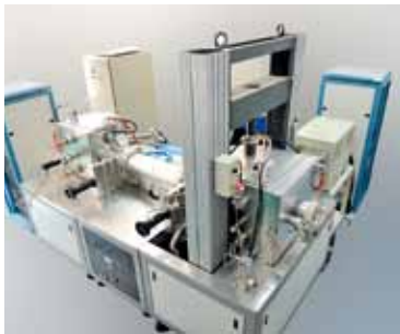
YF-39 极端环境力学评价系统

1. 新一代检测技术和国际标准建立: 开发出特种陶瓷、特种玻璃、绿色建材和建筑节能、资源综合利用等领域系列测试技术及检测设备, 发布4项国际标准, “结构陶瓷典型应用条件下力学性能测试与评价关键技术应用” 荣获国家科技进步二等奖。