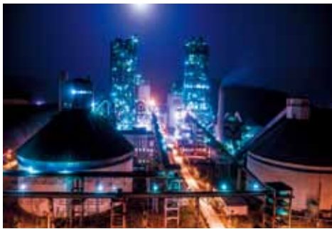
徐州中联双万吨线

利用自主核心技术设计建成徐州中联万吨水泥线，设备国产率达到85%，技术指标均优于同级进口生产线。