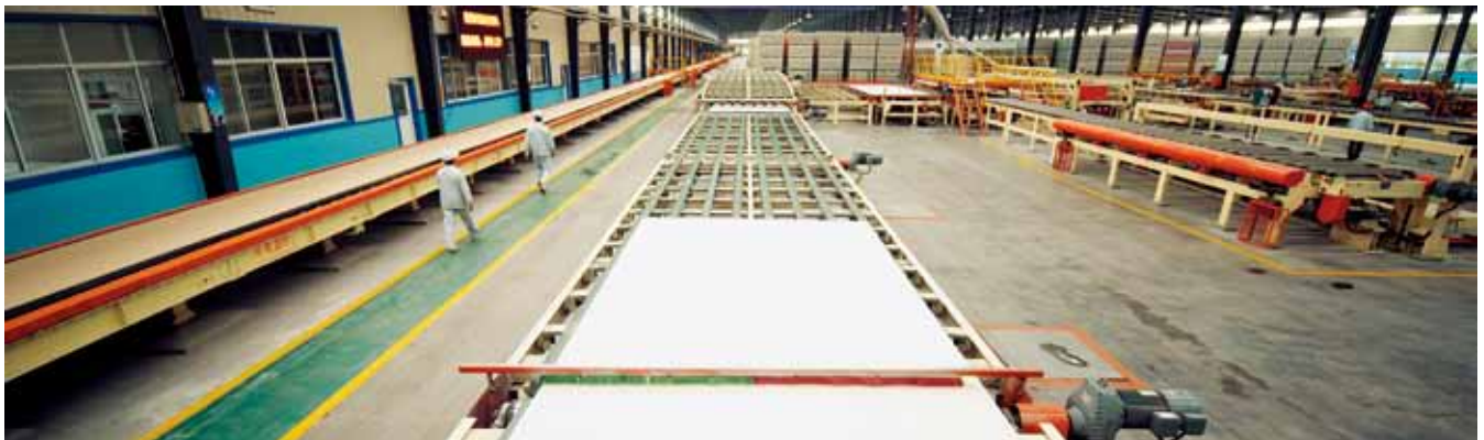
利用工业副产石膏生产纸面石膏板的生产线

二是想方设法节能降耗。多年来，泰山石膏通过不断进行设备技术改造和生产工艺优化，开发了以燃煤热风直接烘干工艺、石膏板干燥机余热利用技术、燃烧炉废气回收利用技术、热风幕技术、一步煅烧制粉工艺和一体化大型热风炉技术为代表的一系列先进工艺和技术，获得国家授权专利196项，其中发明专利13项，实