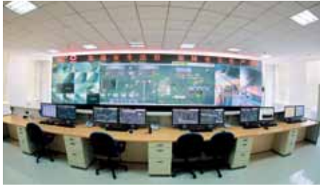
无人值守水泥生产线中控室

1. 日产5000吨低能耗智能生产示范线: 自主设计建成泰安中联日产5000吨低能耗智能生产示范线, 生产实现“无人化”, 综合指标达世界先进水平,