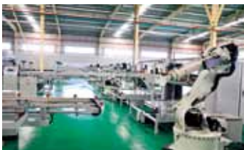
玻璃生产线机械手