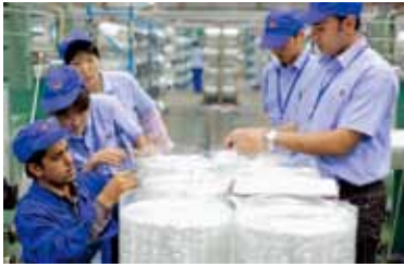
巨石埃及玻纤生产现场

1. 高性能玻纤低成本大规模生产技术: 开发高性能玻纤配方、纵向双H通路结构、智能化成套装备等技术及装备, 总体技术水平达国际先进。建成全球最大的单窑年产能12万吨的智能化池窑拉丝生产线和埃及年产8万吨高性能玻纤示范线, 实现我国玻纤行业首次海外技术输出。 2. 干喷湿纺高性能碳纤维工程化技术: 攻克高性能碳纤维规模化、稳定化生产系列关键技术及装备, 实现千吨级T700、T800级高性能碳纤维的连续稳产, 成为国内唯一、世界第三个掌握干喷湿纺工艺技术企业。产品性能达到国外同类产品水平, 国内市场占有率超过50%。