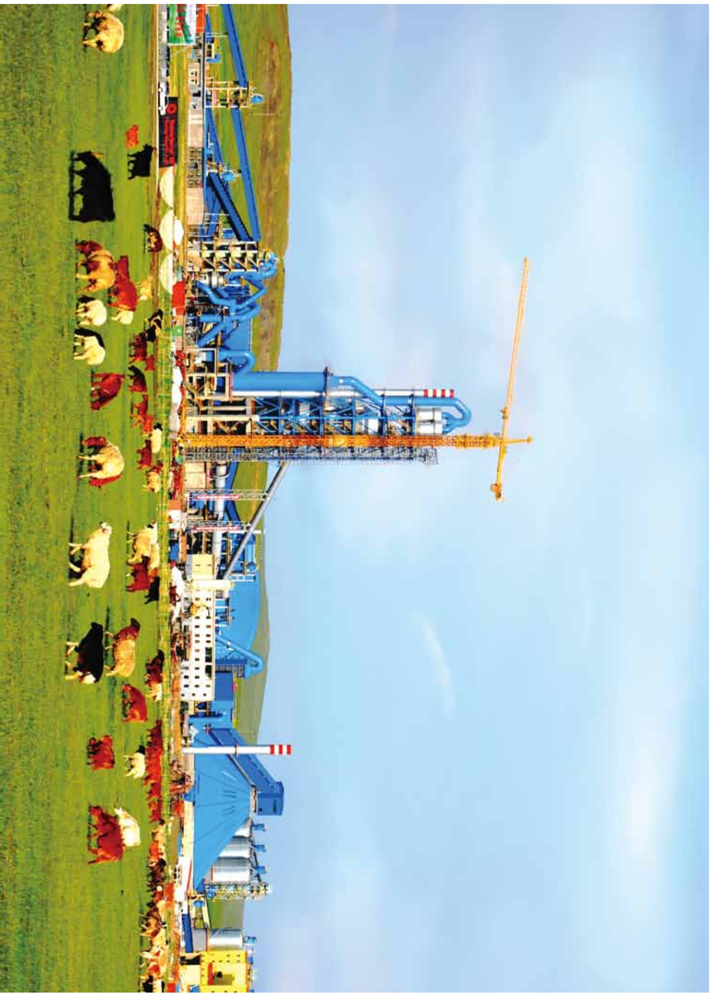
中国建材首条海外投资建设的水泥生产线（中国建材工程工业华拍摄于项目点火当天 地点：蒙古国）