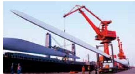
68米6MW风机叶片出口荷兰

1. 兆瓦级大型风机叶片及碳纤维复合材料叶片关键技术: 攻克大型风机叶片产业化关键技术, 研发出国内首台单机功率最大的6MW风机叶片及碳纤维叶片, 建成国内首个10MW级超大型叶片全尺寸结构试验开发平台, 系列产品出口至多个国家地区。