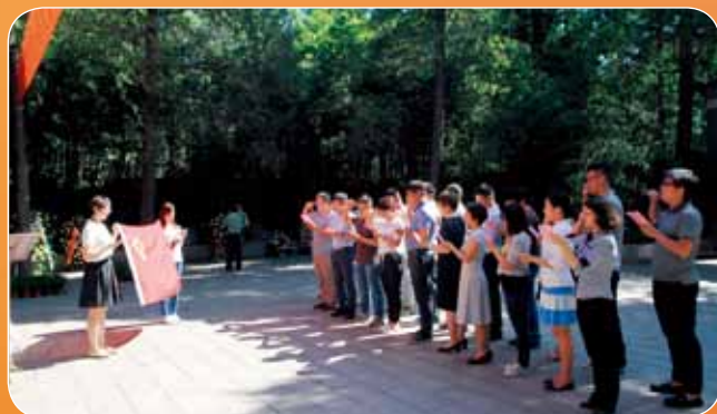
中国建材集团组织在京企业新党员进行集中宣誓，集团总部、在京企业20余名新党员参加。