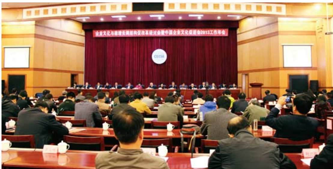
企业文化与稳增长、调结构、促改革研讨会暨中国企业文化促进会2013工作年会现场

业中无一“反水”。什么叫“反水”？就是后悔加入中国建材，半路不干了。原因就是包容的企业文化把大家融合在了一起。