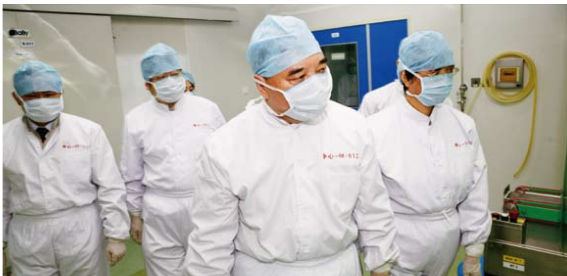
宋志平董事长调研国药集团所属企业

感恩、谦恭、得体”。敬畏，是教育我们的干部凡事都有高压线、都有底线，要在一定规则内行事，绝不能击穿底线。现在社会上发生的很多事都是因为无所敬畏而起，做企业也是如此。如果十几万干部员工都是没有敬畏之心的人，那这个企业神仙也管不好。感恩，指要常怀感恩之心，感谢组织、感谢他人、感谢社会给予的关心、爱护和信任，并以感恩之心予以回报。谦恭，指虚心学习他人长处，不骄傲，不自满，不说过头话，不做过头事，做人做事不张扬。得体，就是举手投足要代表央企，说话办事要三思而后行，不得体的事不做，不得体的话不说。有的年轻干部对我说，这个八字准则我都设成了手机屏保，每天一打开手机就能看到。我说你可以先从最后两个字“得体”做起，然后一项一项地往前做。