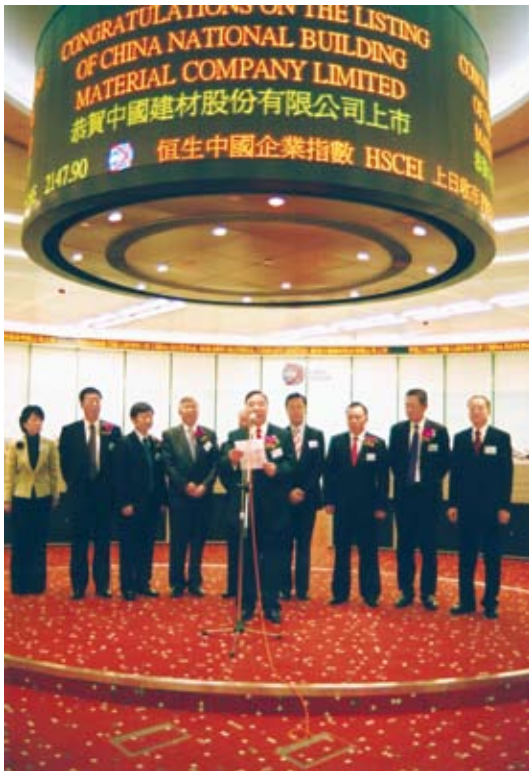
中国建材股份香港上市